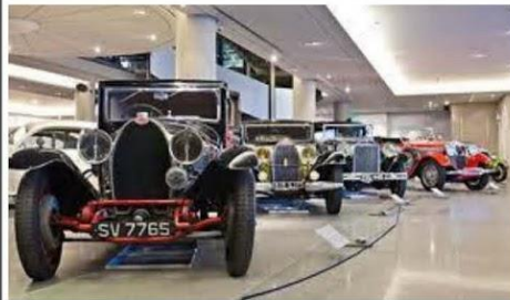
ελληνικό μουσείο αυτοκινήτου