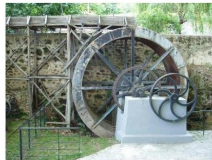
Υπαίθριο μουσείο νερού