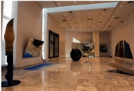
κρατικό μουσείο σύγχρονης τέχνης