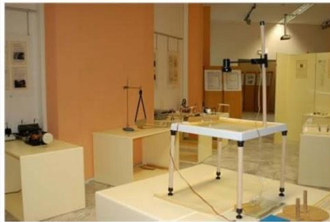
επιστημών και τεχνολογίας