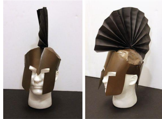
DIY SPARTAN STYLE HELMET www.inspirationmadesimple.com