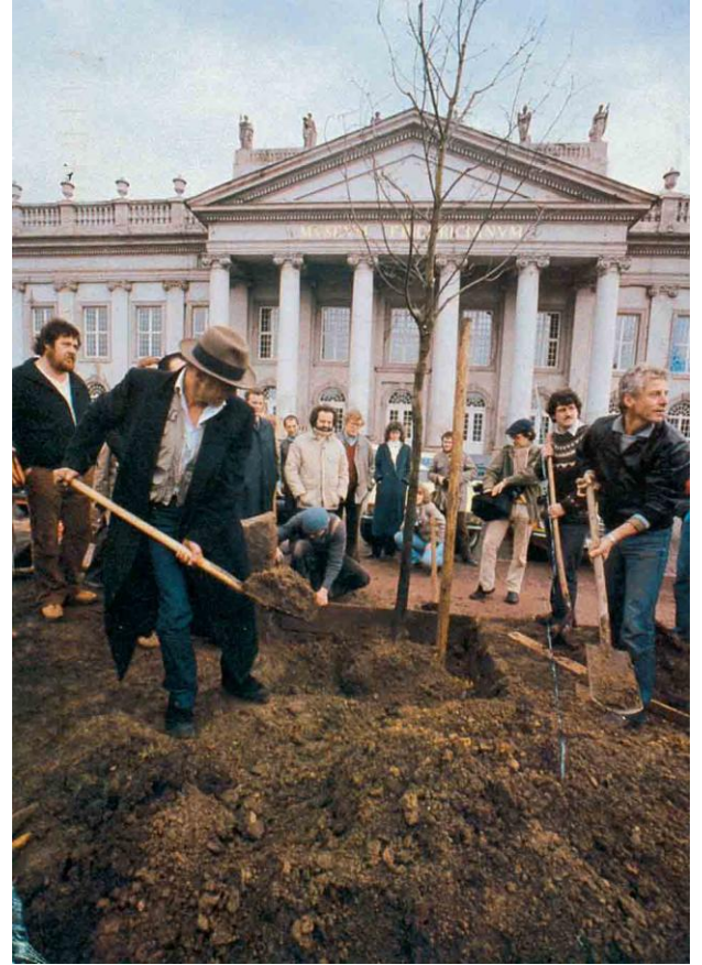
Joseph Beuys - 7000 Oaks on Vimeo