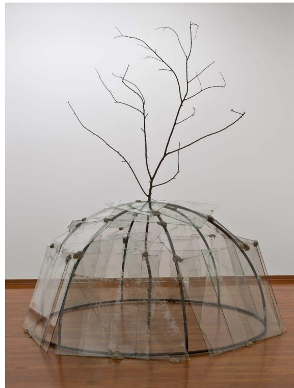
Igloo-1 Germano Celant