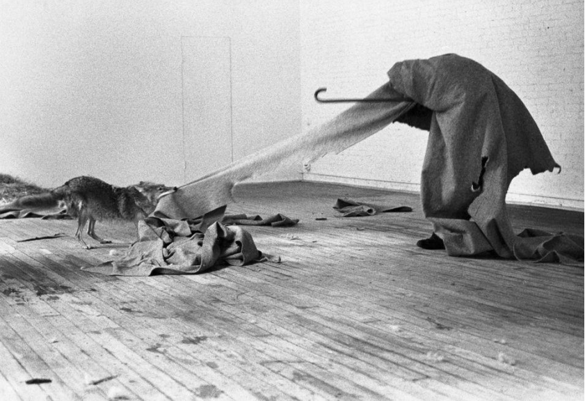
Joseph Beuys' performance Coyote 1974