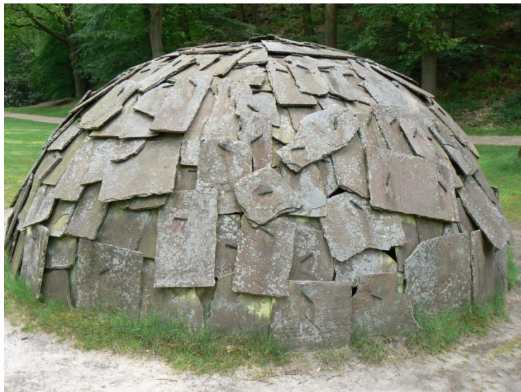
Λίθινο Ιγκλού (1982) του Mario Merz στο KMM sculpturepark. Δείγμα της Arte Povera

Η περιβαλλοντική τέχνη αποτέλεσε μία ακόμη έκφραση του περιβαλλοντικού κινήματος διαμαρτυρίας για τα οικολογικά προβλήματα που προέκυψαν κύρια από το 1960 και μετά. Οι προθέσεις των καλλιτεχνών που εκφράστηκαν μέσα από το μεταμοντέρνο αυτό κίνημα, απέβλεπαν στο πώς, θα δημιουργήσουν τις προϋποθέσεις μιας βιώσιμης ισορροπίας μεταξύ της «ανθρώπινης και μη ανθρώπινης φύσης».